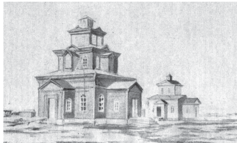
Старый и новый хурул в ст. Эркетинской.