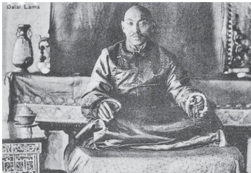
Далай-лама XIII Нгаванг Лобсанг Тхуптэн Гьяцо (1876 – 1933)