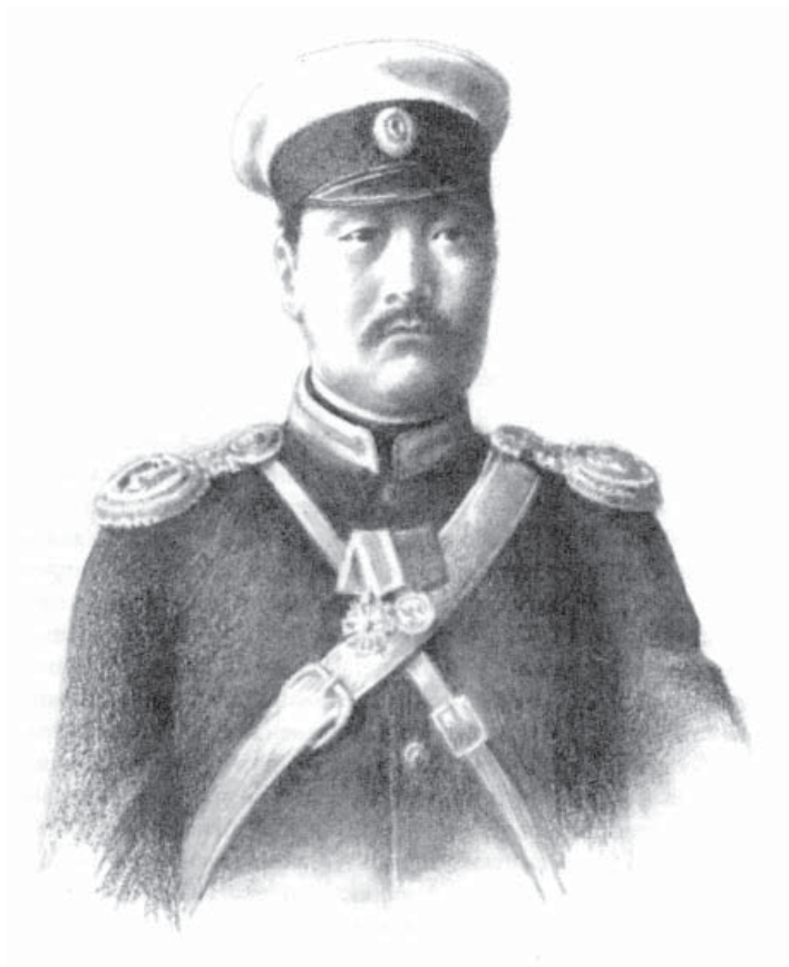
Н. Э. Уланов (1868 – 1904)