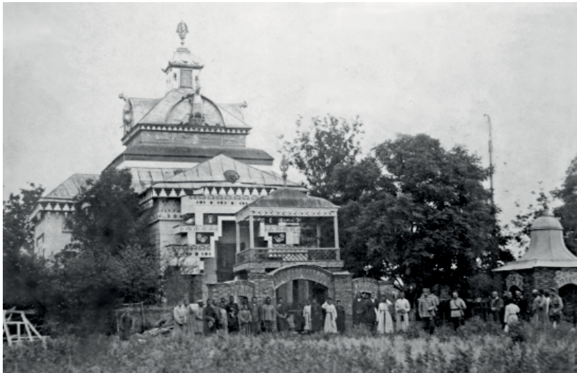
Хурул в ст. Денисовской.

Нынѣ я рѣшился приступить къ переводу медицины съ Тибетскаго языка на русскій, задача крайне трудно выполнимая, изложить на русскомъ языкѣ подстрочно Тибетскій текстъ. Я не позволяю себѣ что-либо измѣнять, выпускать, или добавлять, а передаю всякія аллегорическія и символиче-