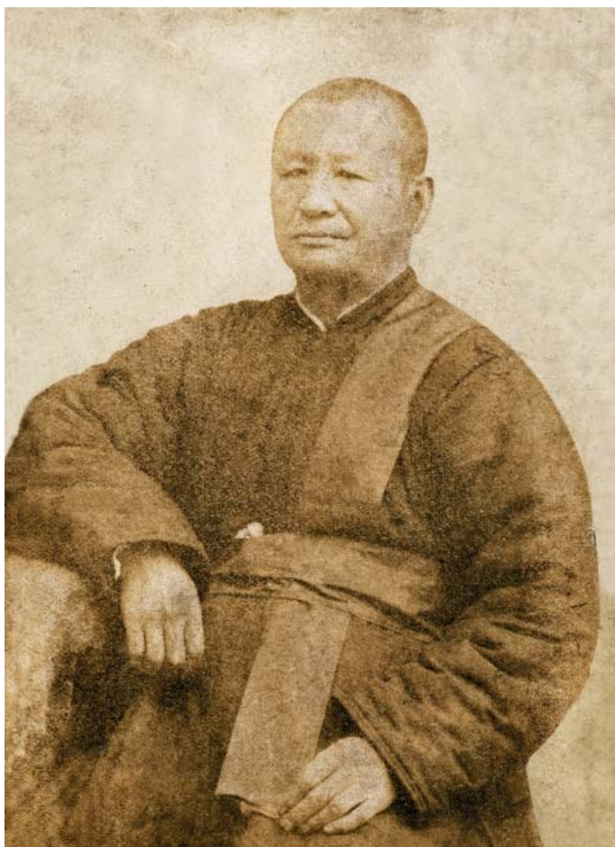
Дамбо Ульянов (1868 – 1913)