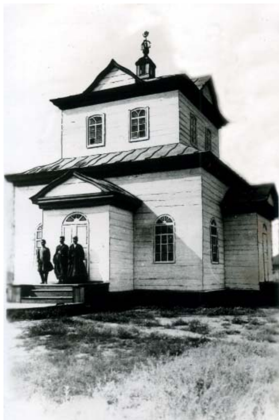
Хурул в станице Чунусовской.