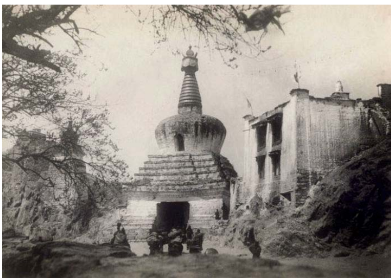
Буддийская ступа. Тибет.