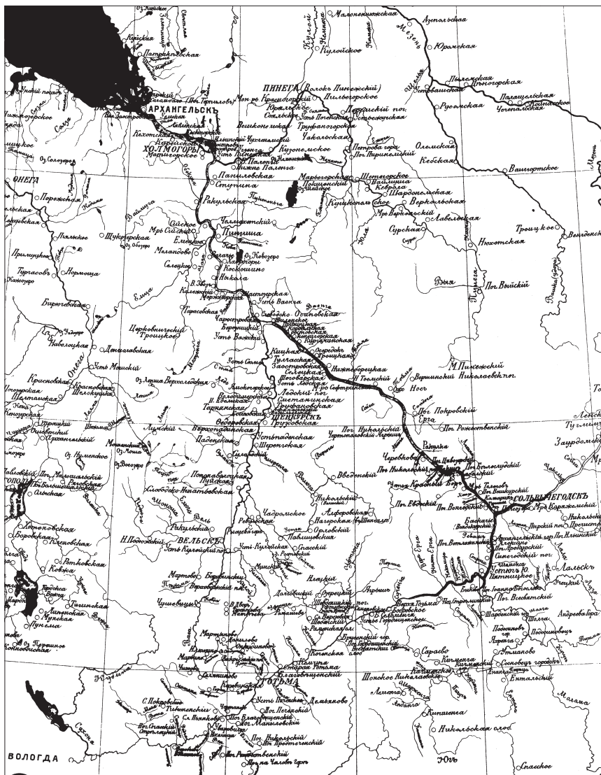
Области Центрального Поморья в XVII в. См.: Карта Поморского края в XVII веке. — Богословский М.М. Земское самоуправление на Русском Севере в XVII в. Т. I. М., 1909.