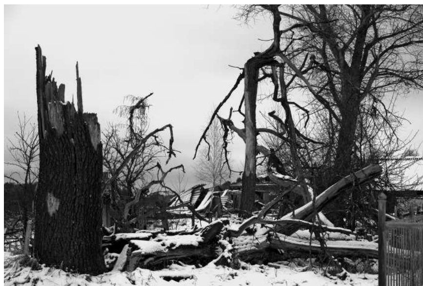
Окраина с. Замошье. Зона отчуждения. Фото Николая Семинога, 2007

ные в 1980 г. и имеющие достаточно сторонников и сейчас. Ученый пришел к выводам, что природно-космические потрясения, влияя на радиационный баланс, резко меняют жизнь человеческого общества: физически и умственно мутирующие люди изменяют общественную идеологию, рушат старые национально-государственные структуры и модели хозяйствования 2 .