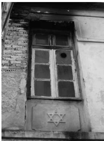
г. Янина. Бывший еврейский дом