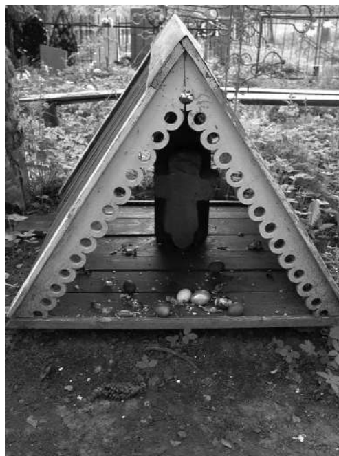
Почитаемый каменный крест на кладбище.

Фольклорные тексты, описывающие пришествие антихриста, восходят к Апокалипсису Иоанна Богослова. Собственно, сама христианская эсхатология является дальнейшим развитием ветхозаветной эсхатологии (книги пр. Исайи, Иезекииля, Даниила и апокрифической литературы – кн. Еноха, Завещания 12 патриархов) 11 . Ожидание конца времен составляло также одну из наиболее существенных черт идеологии кумранской общины, считавшей, что мир уже вступил в эсхатологические времена, а приход «последнего срока» представлялся весьма конкретно и в близком будущем 12 . Апокалиптический образ антихриста перекликается с «человеком зла» (под которым христианские авторы подразумевали Антиоха Епифана) из пророческой книги Даниила.