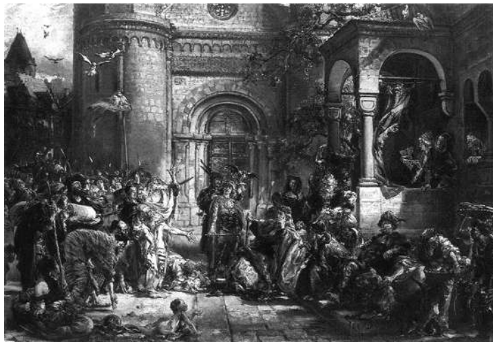
Ян Матейко. Прибытие евреев в Польшу в 1096 году (1889, Национальный музей в Варшаве)