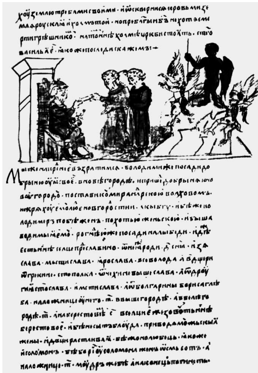
Дружина Олега Киевского клянется Перуном. Миниатюра Радзивилловской летописи (XVв.)