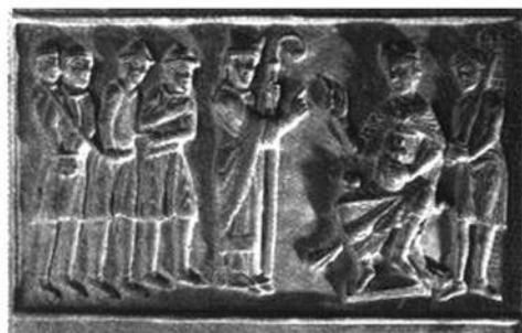
Беседа св. Войтеха с князем Болеславом II