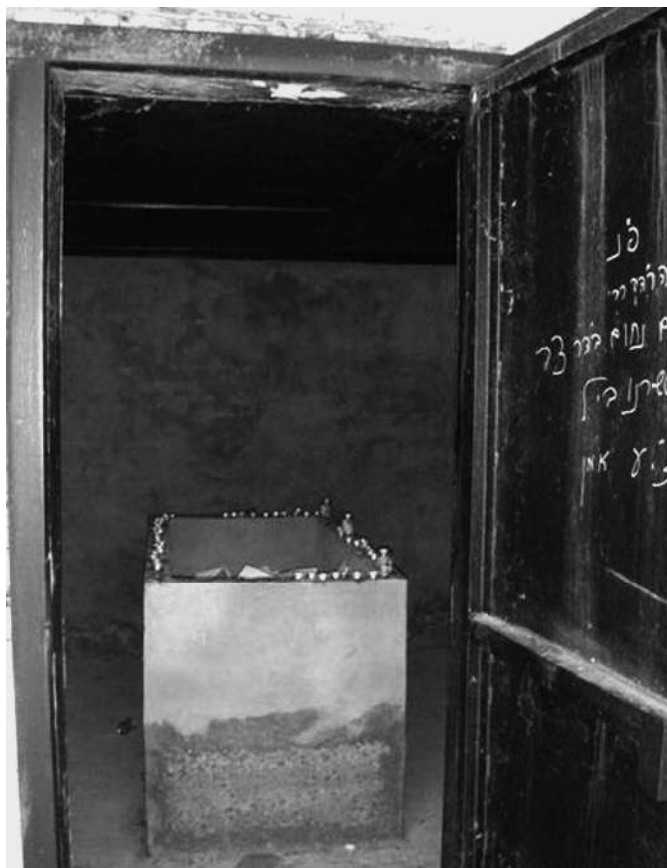
Могила цадика Менахема Нахума Тверского

известна 7 . Небесным патроном чернобыльцев считается святитель Феодосий Черниговский. Люди зоны верят, что Дух способен возродить материю и когда-нибудь они еще смогут увидеть свой Чернобыль цветущим. Режиссер Татьяна Мельниченко в документальном фильме «Старый сон» показывает людей, живущих в атомной пустыне с ощущением Божьей милости, позволяющей самодеятельному поэту слагать стихи: «Я знаю, будут ангелы летать над дорогим Чернобылем моим», а верующей бабушке надеяться, что «Был Чернобыль красен, а будет еще краше» 8 .