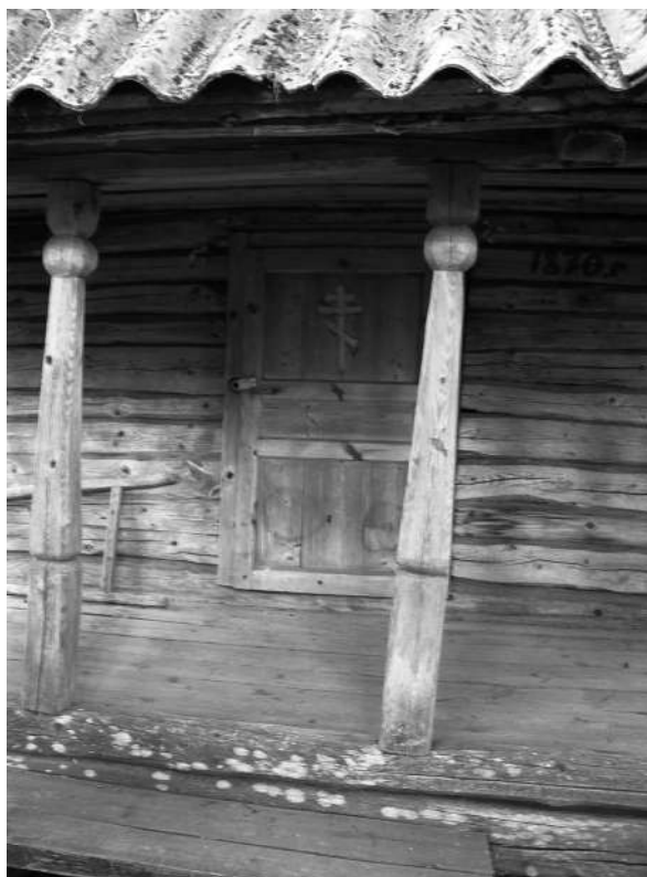
Вход в часовню.