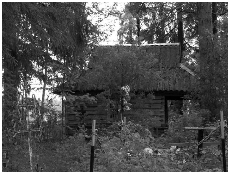
Часовня на кладбище, вид с северной стороны.

Рефлексия, направленная на восприятие переживаемых современных событий сквозь призму новозаветных апокалиптических текстов, традиционна для христианства и, в частности, старообрядчества. Так, протопоп Аввакум, описывая происходящие в Московском государстве события, характеризует их как признаки вселенской катастрофы, предзнаменование апокалиптических «последних времен»: «Воздух, земля и вода выступают из своих пределов. Становится бесплодной земля, не подавая влаги: вода иссыхает, а инде потопляет. Пылают пожары, якоже в Москве пожары видеша очи наша. Разбегаются звери, и разлетаются птицы, в водах умалются рыбы. Вся поднебесная выступает из своих пределов» 8 .