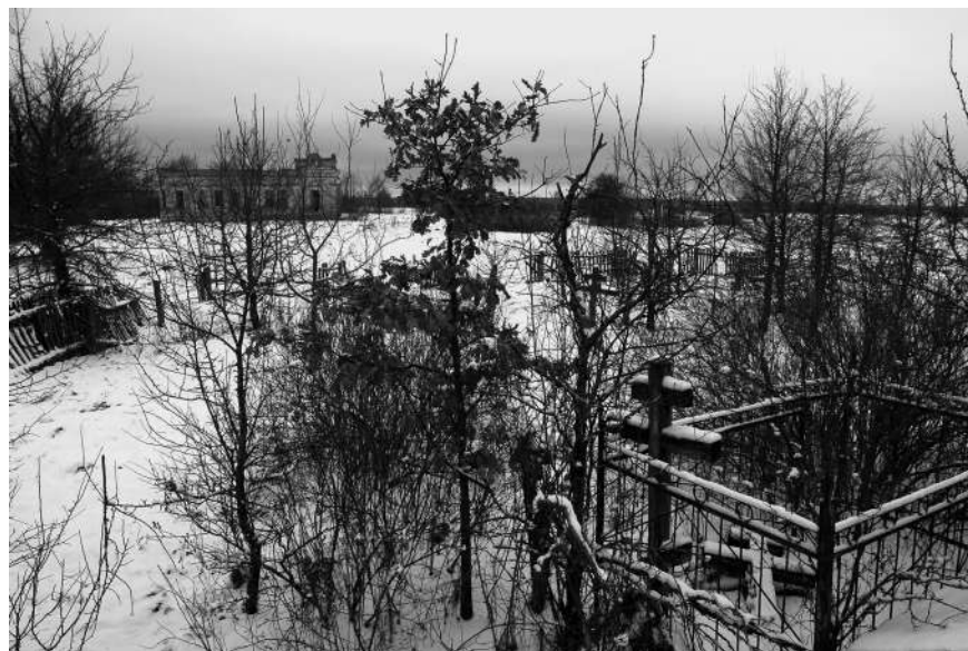
Вид на старообрядческий монастырь, с. Замошье. Зона отчуждения. Фото Николая Семинога, 2007

ствиям власти: в газетах появились интервью с представителями церкви, напоминающими тем, кто ожидал ближайшего конца света, что «о времени сем не дано знать никому». Утрата городом прежнего сакрального центра и своего предназначения «града» – защиты от Леса, от чужого пространства – превратила его в опасную территорию, «зону», живущую по своим законам. Современный Чернобыль-зона, обезлюдев, вырос территориально, теперь он включает в себя еще и город Припять, а также 65 мертвых сел. Сосуществование в нем природного и техногенно-антропогенного факторов (возле реактора, кладбищ техники бродят лоси, табуны одичавших лошадей, в центре города можно встретить стадо диких свиней, дворы зарастают лесом, в домах гнездятся птицы и летучие мыши, здесь живут самоселы, научные работники) создало новую постурбанистическую реальность, отражающуюся в соответствующих культурно-философских интерпретациях.