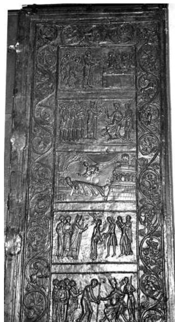
Бронзовые ворота гнезденского собора (левая часть)

Этот сюжет нашел отражение и в одном из ценнейших польских памятников романского периода – бронзовых воротах гнезденского собора (первая половина XII в.) 29 . Гнездно – столица первого польского епископства, именно отсюда в 977 г. св. Войтех отправился в свой последний миссионерский поход. В двух из 18 клейм соборных врат представлены связанные с евреями сцены из жития св. Войтеха: сон, в котором ему является Христос, и наставительная беседа святого с князем Болеславом II, чтобы тот положил конец порочной практике.