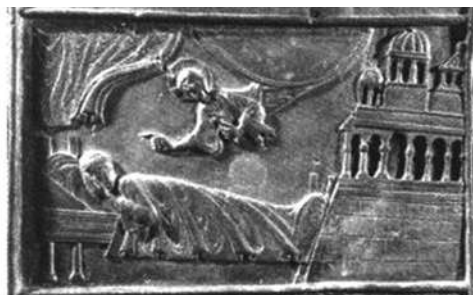
Явление Христа св. Войтеху во сне