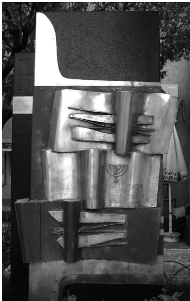
г. Янина. Памятник жертвам Холокоста

жизнь и вспомнить, что значит быть евреем, снова понадобился и был заимствован активистами романиотского возрождения из научной литературы, то есть, снова пришел откуда-то извне. В настоящее время именно эти люди являются единственными активными пользователями этого этнонима, обладающего столь богатой историей. Мне, как этнографу, искренно любящему объект своего исследования, остается только уповать на то, что в случае, если этноним «романиот» снова потеряет свою актуальность, найдется кто-нибудь, кто поможет этому термину возродиться вновь.