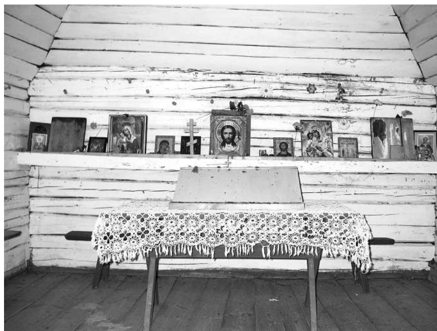
Внутренний вид часовни на кладбище д. Староверский Луг (Запольская волость, Плюсский р-н, Псковская область).

сухое место посередине болота (остров) в прошлом использовалось для выпаса скота. Жителями деревни специально для этого была проложена дорога к нему. Длину возводимой дороги разделили по количеству семей на десять частей. Каждая семья на свой участок возила камни, по краю дороги вырыли канавы. Эта дорога, кое-где заросшая, сохранилась до настоящего времени.