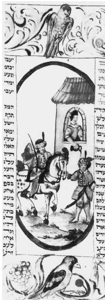
Миниатюра из книги Эстер. Чехия, XVIII в.

Самым, пожалуй, важным отличием преданий о депутатах от парадигматического образца Мегилат Эстер является отсутствие либо полная перекодировка образа персонажа, соответствующего царице Эстер 3 . Депутаты достигают успеха без помощи еврейской жены или возлюбленной какого-либо влиятельного лица, а в тех нарративах, где «прекрасная еврейка» все-таки появляется, она играет деструк-