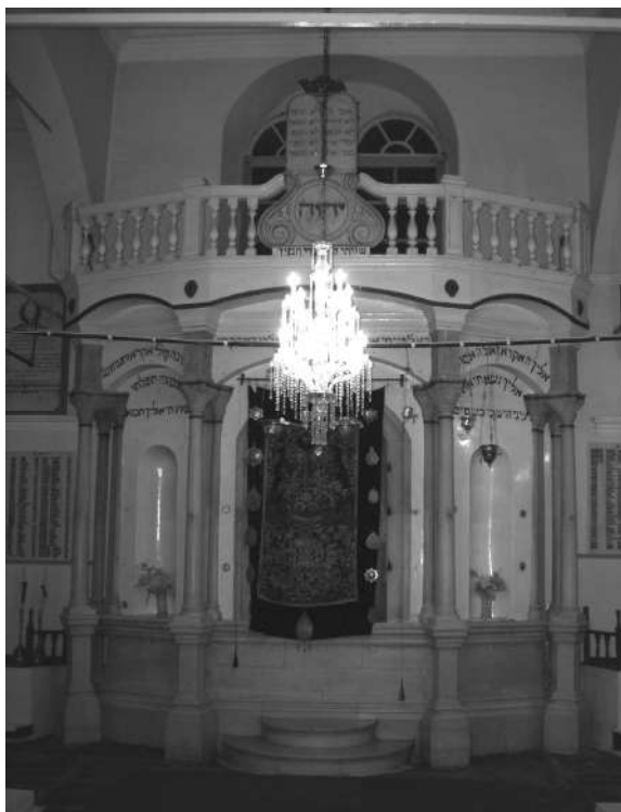
г. Янина. Синагога. Арон-Кодеш

противопоставляли себя («мы греки») другим еврейским общинам («они евреи»), опять же акцентируя внимание на греческой составляющей своей идентичности. К. Флеминг утверждает, что только в Америке эти люди смогли полноценно демонстрировать обе половины своей идентичности – греческую и еврейскую, и, вероятно, именно этим объясняется тот факт, что до последнего времени их вполне устраивало самоименование «греческие евреи», так как именно оно и отражало эти две составляющие их уникальной истории, – в отличие от термина «романиоты», который был непонятен даже многим членам общины, что уж говорить об аутсайдерах. Тем не менее, прихожане янинской синагоги в Нью-Йорке все-таки использовали термин «романиот», но в тех случаях, когда им требовалось ответить на вопрос кто они, одновременно отмежевавшись и от сефардов, и от ашкеназов. Именно потребность в самоназвании, выраженном в одном слове, и стала причиной своеобразного возрождения этнонима «романиот» на американской почве.