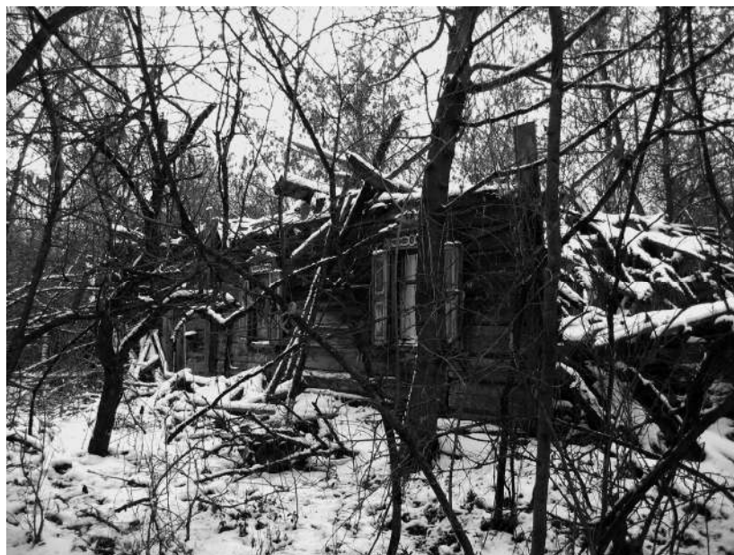
Брошенный дом в с. Черевач. Зона отчуждения.