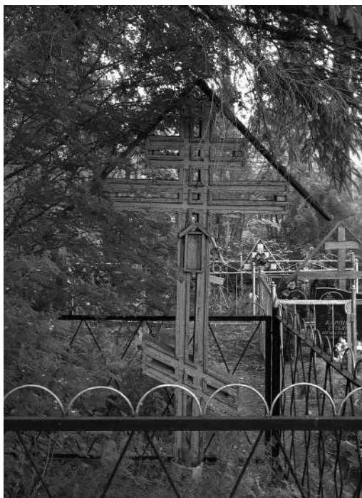
Восьмиконечный резной крест на кладбище.

люди грешили, и всех залило людей. Вот с этого потопа и дано нам 2000 лет. Вот не знаю, что будет: доживем или переживем. Сказано: 2000 лет дано 6 . Примечательно, что современное летоисчисление в этих высказываниях информантами связывается не с датой рождения Спасителя, а с потопом.