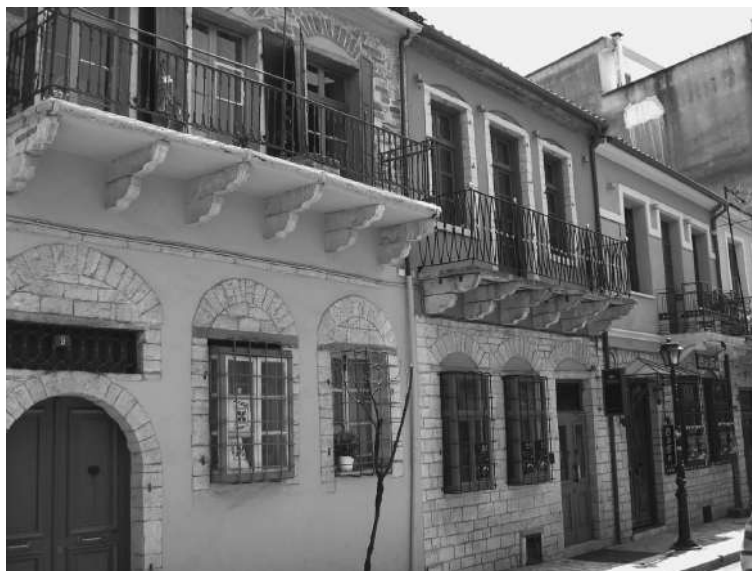
г. Янина. Улица, названная в честь романиотского поэта Йосефа Илия

С другой стороны, из многочисленных самоописаний, созданных представителями этой, честно сказать, не очень очерченной группы, мы можем почерпнуть массу интересных сведений о современной жизни романиотов, о традиционной романиотской кухне, об обычаях и традициях, до сих пор соблюдаемых романиотами. Кроме того, как показывает мои собственные полевые исследования в современных еврейских общинах Греции, которые я проводила в 2005–2008 гг., сами романиотские жители этих общин могут предоставить исследователям материал, которого хватит не на одну книгу о быте и нравах романиотов. Чувствуется какая-то неувязка? Попробуем систематизировать имеющийся материал.